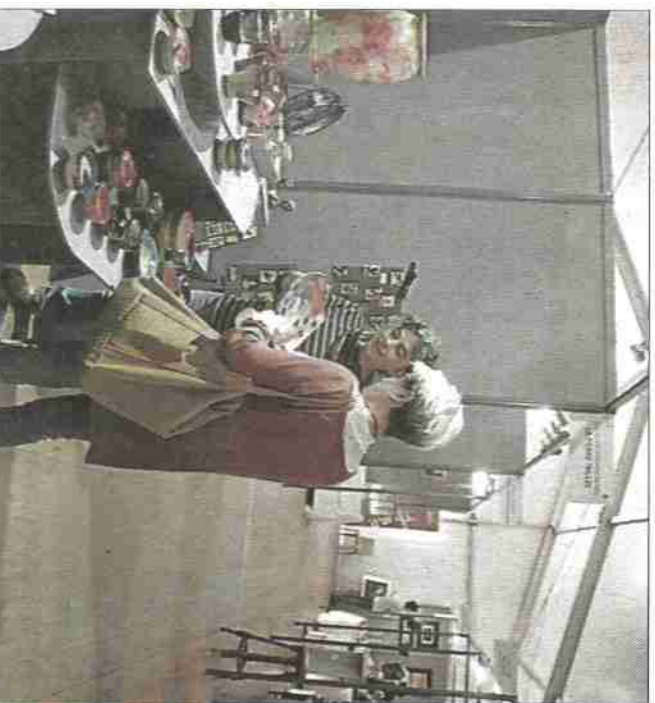
Les créateurs ont investi le cœur de la ville. La municipalité a inauguré cette 17 e édition.

Métiers d'art. Ouvert ce dimanche, de 10 h à 19 h. Entrée gratuite.