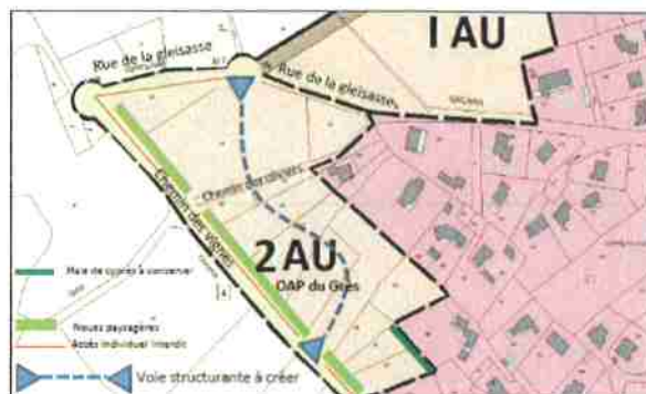
Après la modification