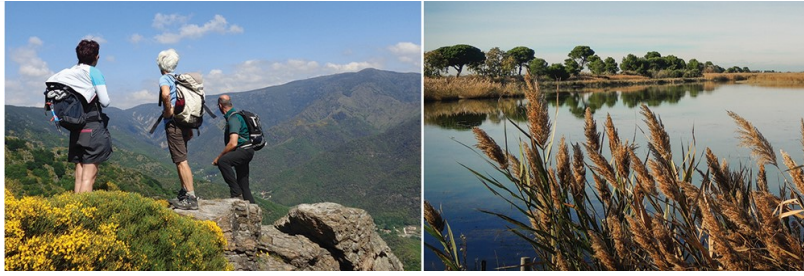
Des Cévennes à la Camargue... (Archives)